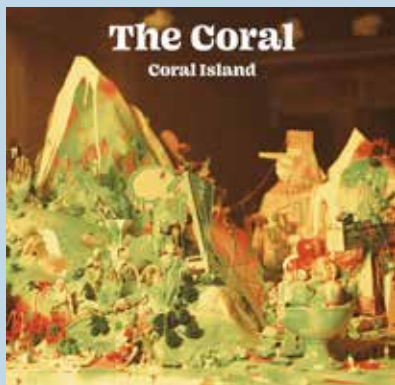
THE CORAL – Coral Island Cd 24 temas (Run On)