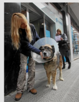
'Goliath' sale a la calle tras recibir el alta médica.