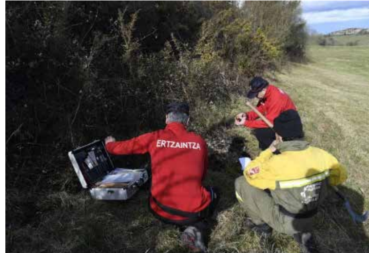
Investigaciones de la Sección relacionadas con animales e incendios forestales.

Todos estos casos fueron significativos para mí porque fueron las primeras investigaciones que hicimos y por su complejidad a la hora de la obtención de información y pruebas. A nivel personal, me impactó mucho la brutal paliza a un perro llamado "Goliath" en Portugalete, que derivó en la detención de su propietario y su posterior condena por maltrato animal. Afortunadamente, "Goliath" sobrevivió a las graves lesiones que sufrió y posteriormente fue adoptado.