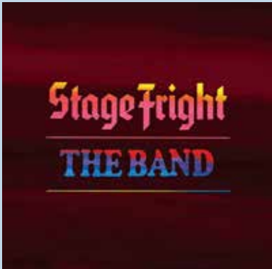
THE BAND – Stage Fright 2CD - 39 temas (Capitol/Universal)