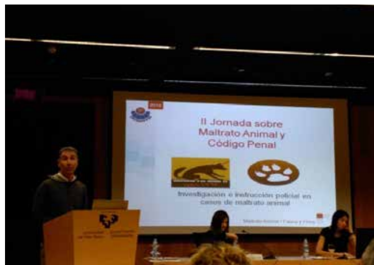
Ponencia en las II Jornadas sobre Maltrato Animal en el Campus de Gipuzkoa de la UPV/EHU. sobre maltrato animal en el Colegio de Abogados de Álava.