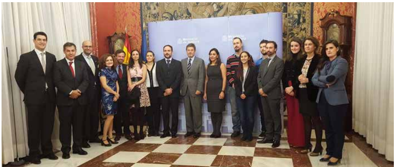
*Ganadores, organizadores y patrocinadores de Justiapps junto al Ministro y la Secretaria de Estado.

Dicho reconocimiento, fue el broche final a una iniciativa ilusionante e innovadora, que fue preseleccionada entre más de 250 proyectos en los Innovating Justice Challenge 2015, convirtiéndose en el único proyecto español finalista en estos reconocidos premios internacionales de Innovación en la Justicia. ●