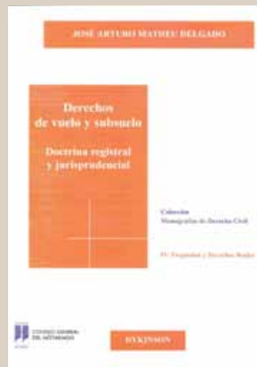
José Arturo Matheu Delgado Dykinson (Madrid)

La presente obra aborda el estudio de los derechos reales de vuelo y subsuelo, analizando abundante doctrina científica sobre tales derechos reales, así como los numerosos pronunciamientos judiciales recaídos en la materia, para sumergirnos, desde una óptica moderna y no carente de un cierto enfoque crítico, en las grandes incógnitas con que se encuentran los Notarios y Registradores en su praxis diaria: los primeros cuando otorgan los títulos constitutivos de tales derechos reales, dada la indeterminación de los mismos debido a los escasos requisitos legales necesarios para su otorgamiento; los segundos, a la hora de efectuar su calificación jurídica y determinar si procede inscribirlos en el Registro de la Propiedad, o en su caso denegar tal inscripción, con el fin de preservar el principio de especialidad registral consagrado en la Ley Hipotecaria.