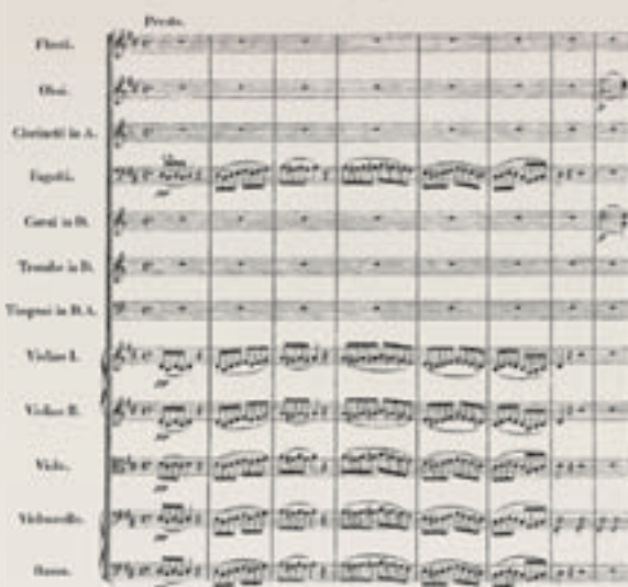
The Marriage of Figaro