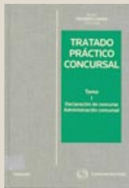
Pedro Prendes Carril. Aranzadi

Este Nuevo Clásico supone la primera obra que aborda todo el conocimiento sobre la reciente Ley Concursal para su perfecta aplicación práctica y jurisprudencial. Cada artículo y disposiciones que la conforman son objeto de comentario por los más prestigiosos profesionales en la materia, haciendo hincapié en los aspectos más problemáticos que su aplicación, así como las soluciones judiciales dadas en cada caso.