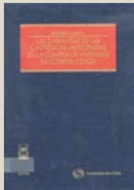
Jesús Estruch Estruch. Civitas

Este libro, trata, con una vocación eminentemente práctica y con apoyo en la jurisprudencia más relevante sobre cada materia, el ámbito de aplicación de la Ley 57/1968, la responsabilidad de las entidades de crédito que abren cuentas especiales para el ingreso de las cantidades anticipadas por los compradores, el seguro en garantía de la devolución de las cantidades anticipadas, el momento en el que las garantías pueden ser canceladas, la posibilidad del comprador de suspender los pagos sucesivos o de resolver el contrato de compraventa ante el incumplimiento por el promotor de la obligación de garantizar las cantidades entregadas, las diversas posibilidades jurídicas de actuación que tiene el comprador ante el incumplimiento por el promotor de la entrega de la vivienda dentro del plazo establecido en el contrato, o los requisitos del aval bancario y la póliza de seguro para ser considerados títulos ejecutivos de los previstos en el artículo 517.2.9º LEC.