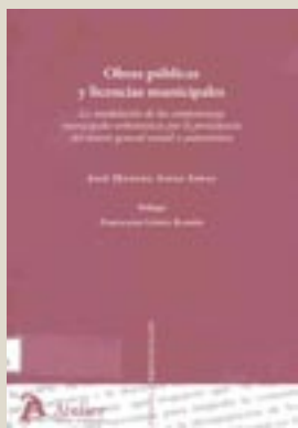
José Manuel Aspas Aspas. Marcial Pons

En este estudio se expone la evolución del ordenamiento urbanístico español al regular la intervención municipal de las obras y usos del suelo por las Administraciones públicas. Estudiando fundamentalmente la convivencia de dos vías distintas en lo que respecta a la licencia municipal de obras públicas, la exención y el procedimiento excepcional, y los problemas que plantea en la práctica.