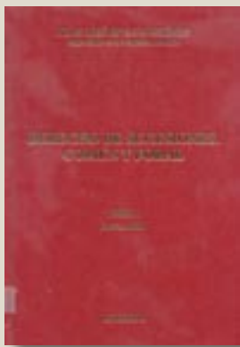
Juan José Rivas Martínez. Dykinson

La presente edición recopila en tres tomos la magna y más importante obra sobre el Derecho de Sucesiones Común y Foral de la bibliografía jurídica española en la actualidad, puesta al día con la última normativa civil, común y foral.