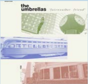
THE UMBRELLAS – Fairweather friend CD 10 canciones (Tough Love)

Baladez eta denbora erdiz betetako diskoa da, horietako bat deigarria, “Dime”, adibidez, Cancamusa batería eta abeslari txiletarrak ahotsean parte hartzen du, eta bat-batean “Time will tell” bezalako pieza jarkiezinak edo “Payback” hori bezalako geldiezinak aieratzen dira, non Nick Waterhouseren gitarra ageri den. Azken batean, disko bitxia da, interesgarria baino gehiago, nahiz eta oraintxe bertan ikuspen handirik ez duen kategoría baten barruan sartuta egon — soul modernoaren kategorian, alegia —. Zer entzuten den oso gustura, errepikatzeko gogoaz uzten du eta, gainera, eta horrela esan behar da, kanonikoa den soinu bat eguneratzeko ahaleginean, soinu hori erabat menderatzen du. Horrelako gauzak egin nahi dituenari eskatu beharreko gutxienekoa dela uste dut.