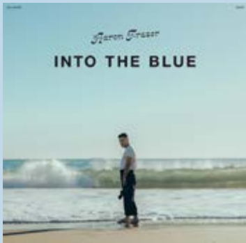
AARON FRAZER – Into the blue CD – 11 canciones (Dead Oceans)