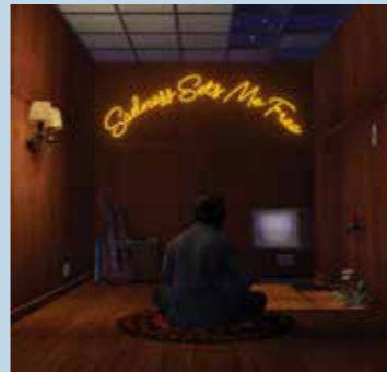
GRUFF RHYS – Sadness sets me free CD 10 canciones (Rough Trade)

Kontua da Billy Braggen kantuak etengabe entzuten ari naizela azken egunetan, laurogeiko hamarkadaren erdialdeko Bilbora atzera eramateaz gain (The Jam, Love, Kate & Anna McGarrigle...), egin duen bidearekin, Wilco edo Joe Henryrekin egindako diskoekin, besteen abestien bertsio bikainekin (The Jam, Love, Kate & Anna McGarrigle...), eta artista gisa izan duen bilakaerarekin, gaur egun arte erabat kontziente izan gabe lagundu nauela, denboraren igarotzea jasateaz gain, bere buruarekin eta bere idealekin soilik konprometituta dagoen artista baten bilakaeran bikain egokitzen diren abestiei esker.