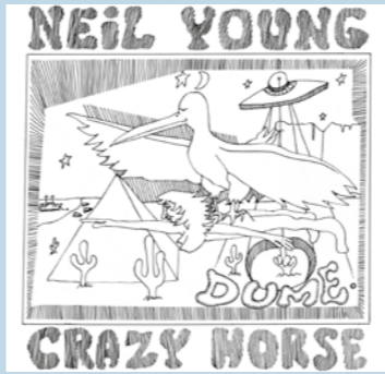
NEIL YOUNG – Dume Lp 16 canciones (Reprise)

Tras media docena de álbumes en los que ha ido dibujando una visión musical singular, en la que han cabido bandas sonoras imaginarias, piezas orquestales, folk-rock, rock nacido del grunge o simple y llanamente baladas de esas en las que el artista se abre en canal, lechyd Da parece ofrecer una continuación nada previsible y además enriquecida con un trabajo de producción extraordinario, verdadera magia en el estudio. Pura melancolía, pero también optimismo. Podría serlo, pero sin embargo no es un disco nada oscuro (y mira que su voz, cerrada y hasta un tanto opaca, ayuda poco en la búsqueda de luminosidad...), sino que por el contrario por momentos apunta a cierta euforia empujado por una orquestación impetuosa, estribillos solemnes y brillantes y muchísima elegancia. Que a veces el intimismo roce lo exagerado, o que todo resulte un poco trascendente, terminan por ser detalles irrelevantes. Es un trabajo soberbio que asegura decenas de escuchas, ahora que acaba de aparecer y muy probablemente en el futuro. Ryder-Jones ha comentado alguna vez que está contento con su éxito, que no le importaría tener un poco más, pero que no quiere tener muchísimo más, simplemente por el miedo que le genera la poca gobernabilidad de estas cosas. Con lechyd Da puede dar ese pasito adelante deseado, pero al ser tan bueno por los motivos correctos, será paradójicamente difícil que le convierta en un artista de masas. Una buena noticia.