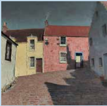
BILL RYDER-JONES – lechyd da CD – 13 Canciones (Domino)