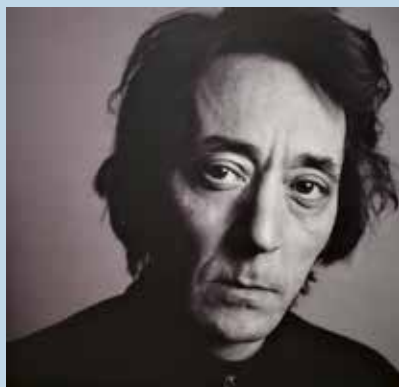
VVAA LA VIDA QUE AMO – Un homenaje a Rafael Berrio CD - 13 Canciones (Warner)